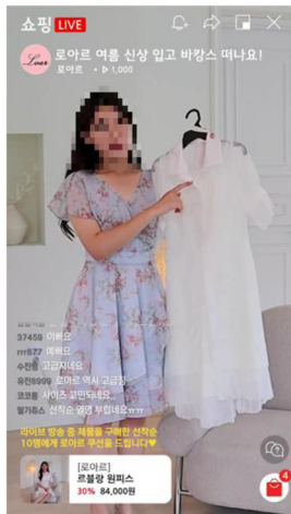
<그림 2> 실험 영상 화면 예시

네 가지 유형의 영상 가운데, 1번 영상은 대리경험 ‘저’, 실시간 상호작용성 ‘저’의 형태, 2번 영상은 대리경험 ‘저’, 실시간 상호작용성 ‘고’의 형태, 3번 영상은 대리경험 ‘고’, 실시간 상호작용성 ‘저’의 형태, 4번 영상은 대리경험 ‘고’, 실시간 상호작용성 ‘고’의 형태로 제작하였다. 실험 참여자들은 1~4번 영상 가운데 하나에 무작위로 배정되어 약 7분 길이의 영상을 모두 시청한 후, 설문에 응답하도록 하였다.